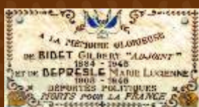
Plaque en façade Mairie de Meillard